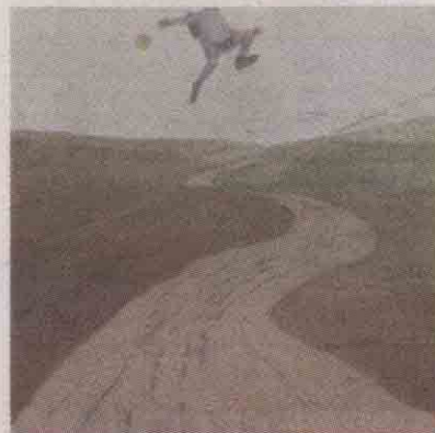
Arriba: "La Loma de Belén", lápiz sobre papel, 2004, debajo: "Sueño de escolar"; dibujos de Sergio Sanz

actualidad, y muchas de ellas bocetos de acrílicos expuestos en esta galería en sucesivas individuales suyas.