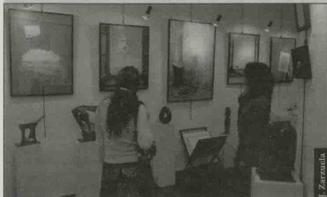
La muestra se abrió al público el pasado sábado.