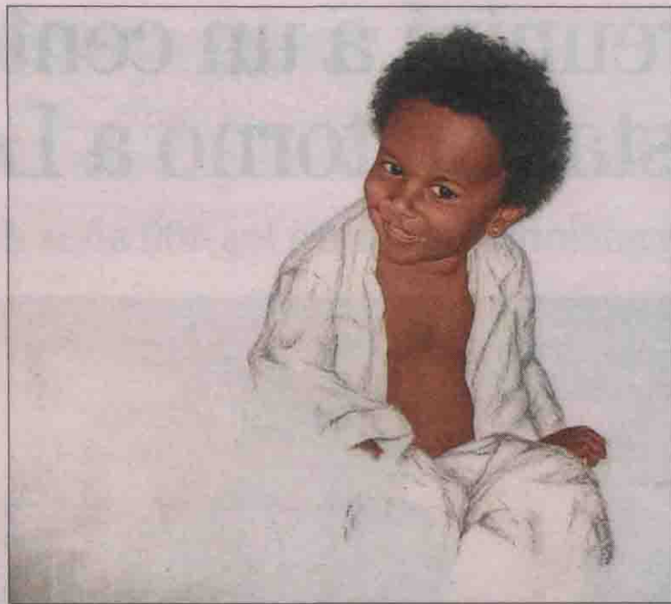
La obra 'Daniella', óleo sobre lino expuesto en Guadalajara.

«Le estoy enormemente agradecido a este país tan fantástico y en especial a la ciudad de Guadalajara, ya que este año expondré