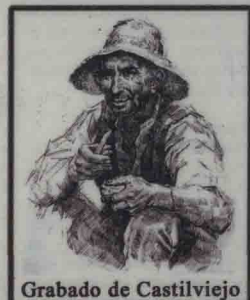
Grabado de Castilviejo

"Ven con Nosotros" Sede: Centro Cívico Zona Sur Teléfonos: 983 355973 - 661 971578